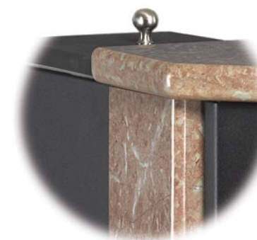
Svart kamin med topp och sida i grå ölandssten