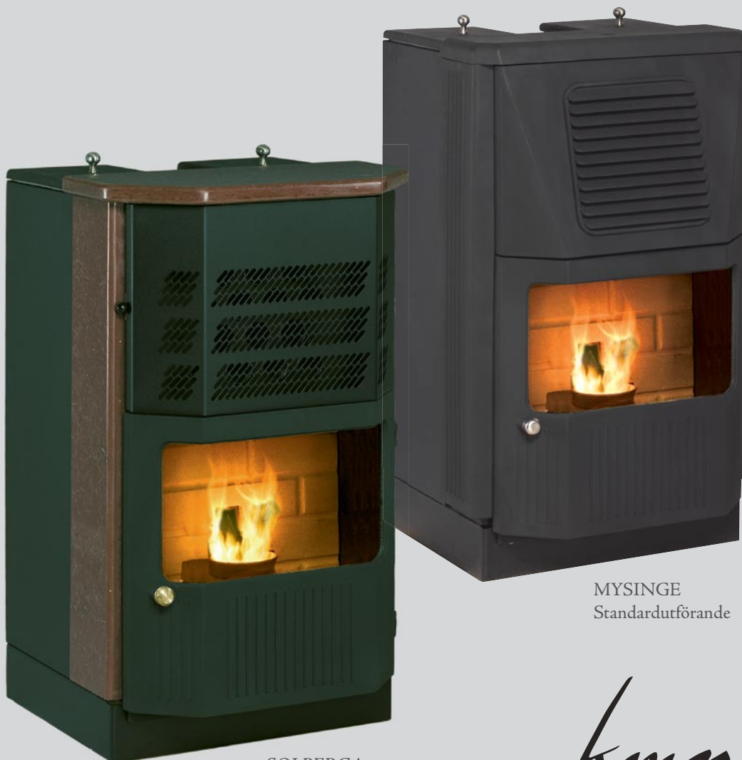
SOLBERGA Extrautrustad med lucka i gjutjärn och topp och sida i röd ölandssten.