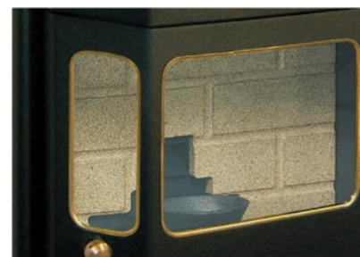
Solberga-kaminen på omslagsbilden är extra-utrustad med dörr i gjutjärn. Standard är plåt-dörr med mässingslist.