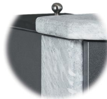
Antracitgrå kamin med topp och sida i täljsten